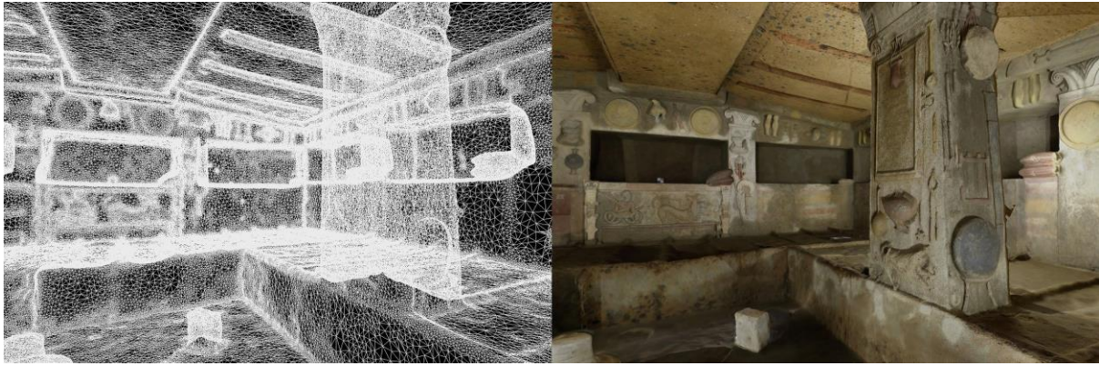
Tomba dei Rilievi, Cerveteri. dall'alto: esempio di panorama sferico; Orientamento dei panorami e ricostruzione del modello mesh; dettaglio del modello completo di informazione colore ottenuto a seguito del processo fotogrammetrico.