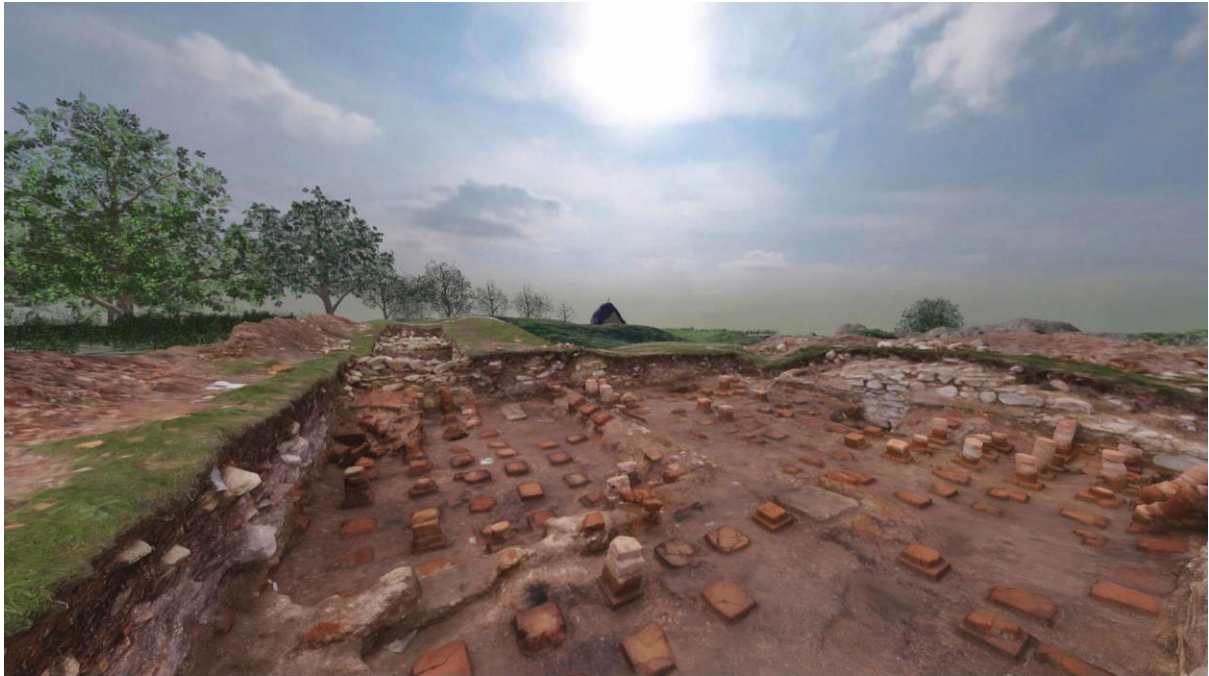
Sarmizegetusa Ulpia Traiana, Romania. Implementazione del modello 3D all'interno di un sistema di realtà virtuale per visualizzazione immersiva HMD (background realizzato in computer grafica).