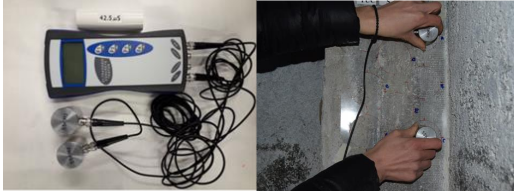
Figura 2. (a) strumento ultrasonico Matest C369N; (b) test in situ presso la Torre intitolata ai caduti del secondo conflitto mondiale (Torricella Peligna, CH)

Valutazione dello stato di conservazione e presenza di strati con diverso stato di conservazione, individuazione di difetti interni di strutture in cemento/calcestruzzo; determinazione estensione in profondità di fessure; valutazione di trattamenti consolidanti su pietre; la misura ultrasonica viene utilizzata come riferimento per test di invecchiamento accelerato (tipo gelo-disgelo).