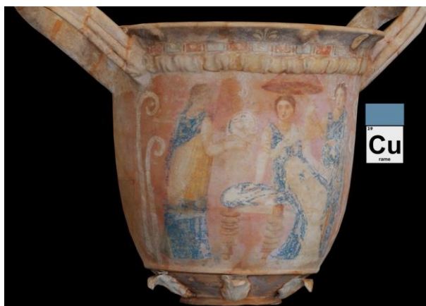
Ricostruzione tramite fotogrammetria del modello 3D della mappa MA-XRF rotazionale di un'urna ellenistica.