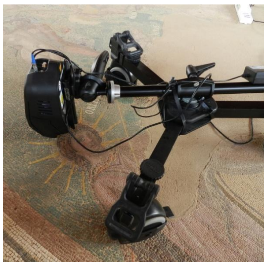
Figura: Condizioni operative dello spettrometro XRF Elio durante misure in situ.